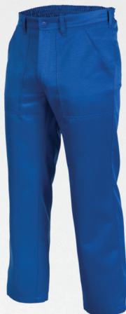
Spodnie do pasa / Trousers