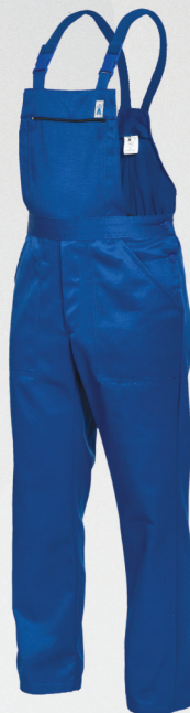
Spodnie ogrodniczki / Bib and brace